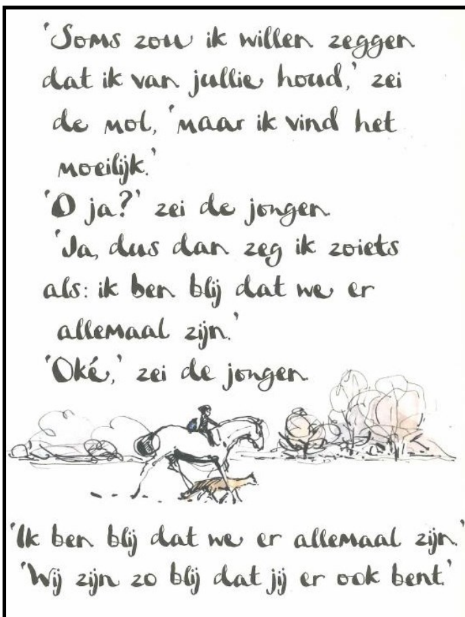
Uit het boek: "De vos, de mol en het paard" Charlie Mackesy